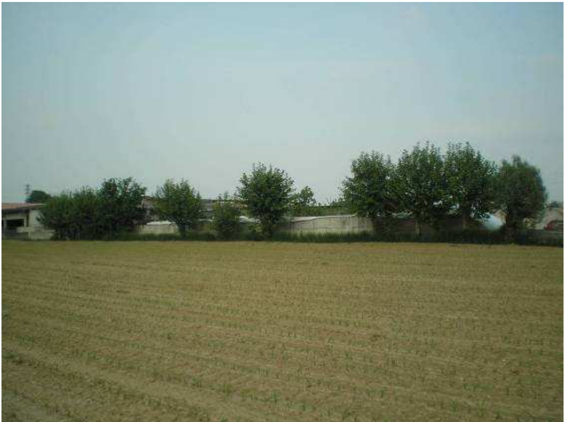
Foto 2- Vista campo lungo da Sud-Ovest