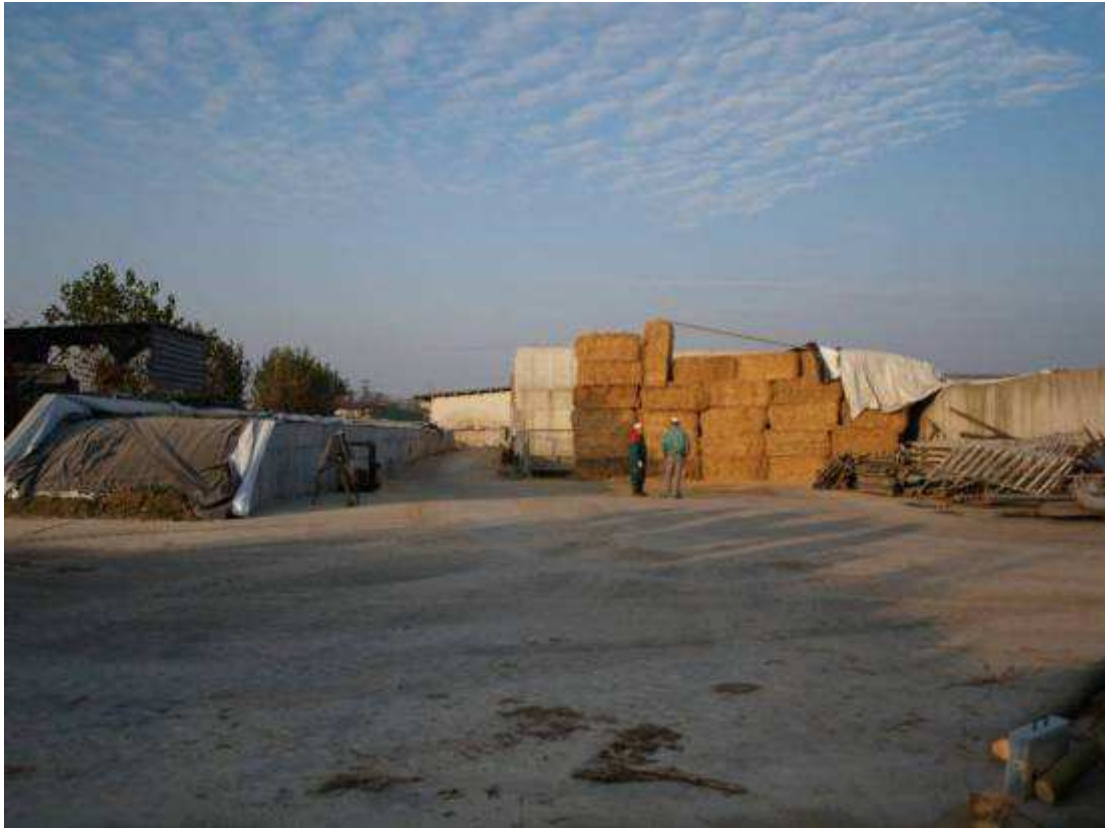
Foto 3 – Vista da Sud – visuale del piazzale dove viene depositata la paglia e attualmente coperta con teli impermeabili