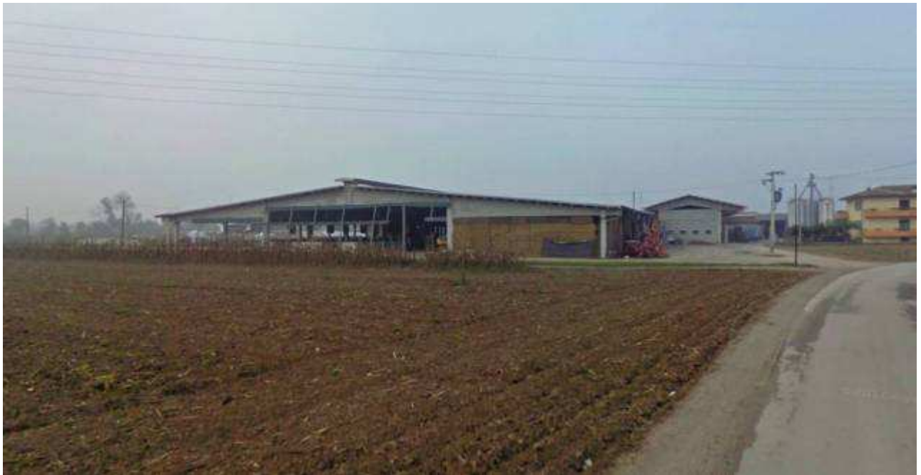
Foto 6 – Vista da Est, da via Astico Lupia, l'edificio principale dell'Azienda adibito a stalla