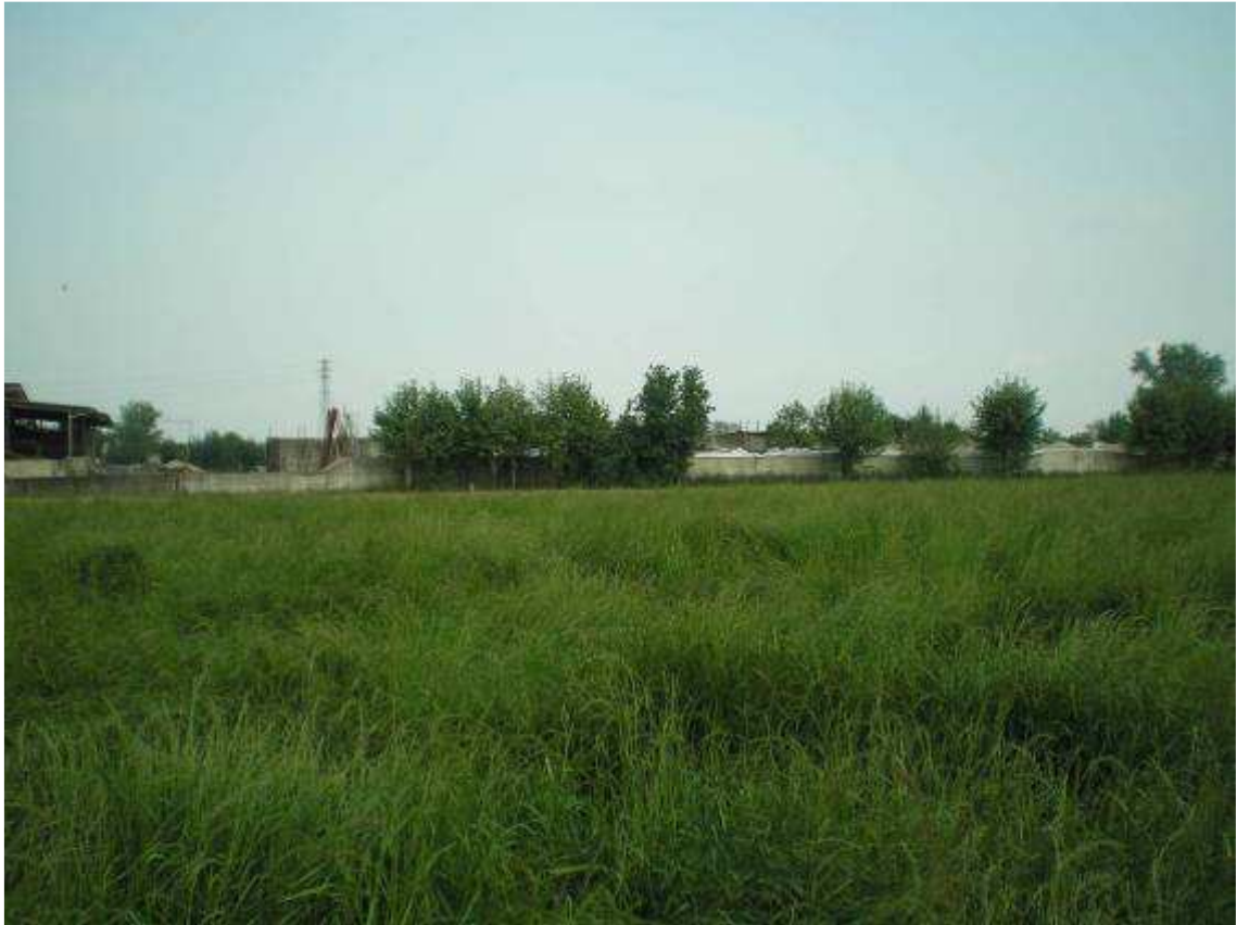
Foto 1 – Vista da Ovest – i silos esistenti già parzialmente occultati da essente autoctone